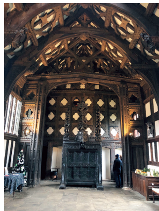
图2: 拉福德旧礼堂, 兰开夏郡, 英国。 礼堂内部装饰有巨大的雕花屏风, 该屏风由多块沼泽橡木拼接而成