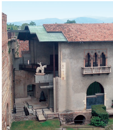
图 5 卡斯特维奇博物馆，意大利维罗纳 (1959—1973)。卡洛·斯卡帕对卡斯特维奇博物馆的改造如外科手术一般杰出

来自比利时罗布雷希特·恩代姆事务所 (Robbrecht en Daem) 的建筑师们在改