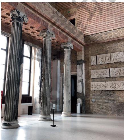
图 4: 柏林新博物馆, 大卫·齐彭代尔和茱利安·哈罗普建筑事务所, 2009 年。 在既存建筑被修复到可以正常运行的程度后, 建筑师便不再添加干预。因此建筑上老化的痕迹得以保存

19 世纪, 西方对究竟应采用创造性修复还是完整保存的争论一直不断。除了上文提到的勒·迪克和拉斯金, 许多其他建筑实践者和理论家也参与到这一议题的讨论中, 与众人共同商议既存建筑应当如何改造和扩建。其中比较知名的包括奥古斯都·威尔比·诺斯摩尔·普金 (AWN Pugin)、阿洛伊斯·里格尔 (Alois Riegl), 以及乔治·德希奥 (Georg Dehio)。对这个论题的空前关注最终导致了 1931 年《雅典宪章》的颁布。《雅典宪章》是保护领域第一部具有重大意义的国际宪章。《雅典宪章》发布后, 涌现出大量可以左右保护学科发展的国际宪章。其中最著名的无疑是《威尼斯宪章》。《威尼斯宪章》是一套保护文物建筑及历史地段的准则, 由一群本领域专家于 1964 年在威尼斯制定。《威尼斯宪章》试图通过建立和固化共识的方法, 建立一个系统化的方法论。《威尼斯宪章》认同新旧之间应该有明显的区别。最重要的是, 该宪章强烈谴责了模仿这一行为 (有趣的是, 法语和英语中“模仿”一词完全相同, 不知是谁在效仿)。