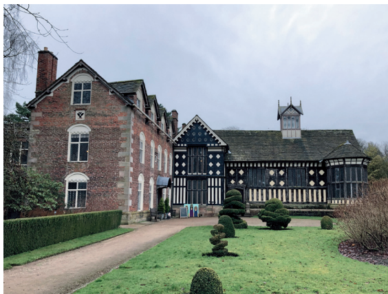
图1: 拉福德旧礼堂, 兰开夏郡, 英国。 礼堂最初的露明木构架建于1530年左右, 砖砌的新增部分建于1661年

真正将创造性重建推向了巅峰的是法国建筑师维奥莱·勒·迪克 (Violet-le-Duc, 1814—1879)。勒·迪克认为建筑师有权对建筑进行创造性修复，并填补建筑缺失的空白。他认为，建筑应当 (也必须) 被恢复到它“原始的”状态，无论这种状态是否真实存在。那么什么是建筑“原始的”状态呢？作为一个目光长远、勇于使用新材料的激进派，维奥莱·勒·迪克一度是法国最为繁忙的修复建筑师。在他身上影射出19世纪中叶法国平衡现代和传统所花费的精力。对维奥莱·勒·迪克而言，修复的目的是发掘建筑体的艺术精髓，并据此恢复建筑最理想化的、统一的、真实的风貌。他提出了一种称为“发明性修复” (Inventive Restoration) 的学说。在他的学说中，建筑师具有艺术创作自由，可以合理推测建筑原本的外观特征，可以要求按照自己认为合适的风格来进行重建和修复。建筑师对原始建筑的理解可以与实际并不相符，但须符合该建筑的精神。他认为纪念性建筑的核心并不是物质存在，而是从历史中剥离出来的某种抽象化、理想化的东西。他相信自己具有创造性地阐释修复既存建筑的权力。