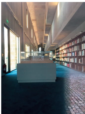
图8: 波尔多市档案馆, 法国, 罗布雷希特·恩代姆建筑事务所, 2016年。 从室内长边看过去, 装有空调的箱体从一楼向上堆叠

因此我们发现, 在现代时期, 对于室内建筑和建筑再利用的态度不断发展: 从前工业时代必须以当时风格进行必要性加建的做法, 到创造性重建、不加区分的保存、对比和类比, 最终回归到填补历史空白类的手法。而到了后现代时期, 常用的改造手法变成了创建整体性——即新增加建需和谐地补完建筑。为了创建一座能够响应过去和未来的完整新建筑, 建筑整体性的概念不仅限于视觉, 亦经常包括可持续性、环境问题、材料和智能性等问题。