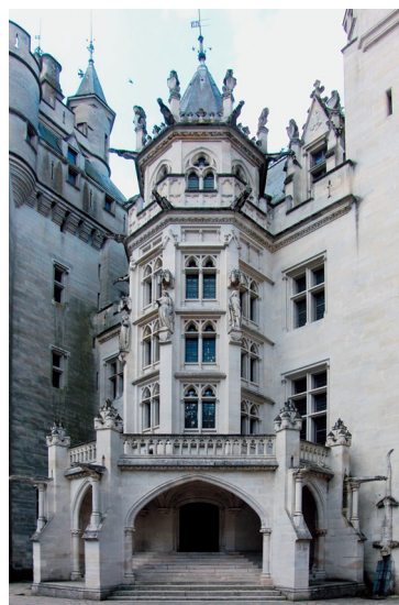
图 3. 19 世纪维奥莱·勒·迪克对皮埃尔丰城堡进行了彻底的修复。这种修复与其说是保护, 不如说是对该建筑的重新翻译

1877 年, 威廉·莫里斯, 菲利普·韦伯 (Philip Webb) 和其他创始人共同撰写了