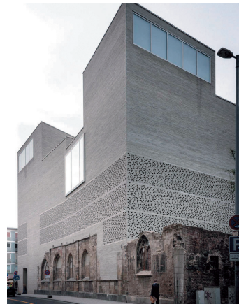
图 6 彼得·卒姆托，科隆柯伦巴艺术博物馆，2007。通过精细的施工，这座建筑得以在原始建筑的遗存上完整建成