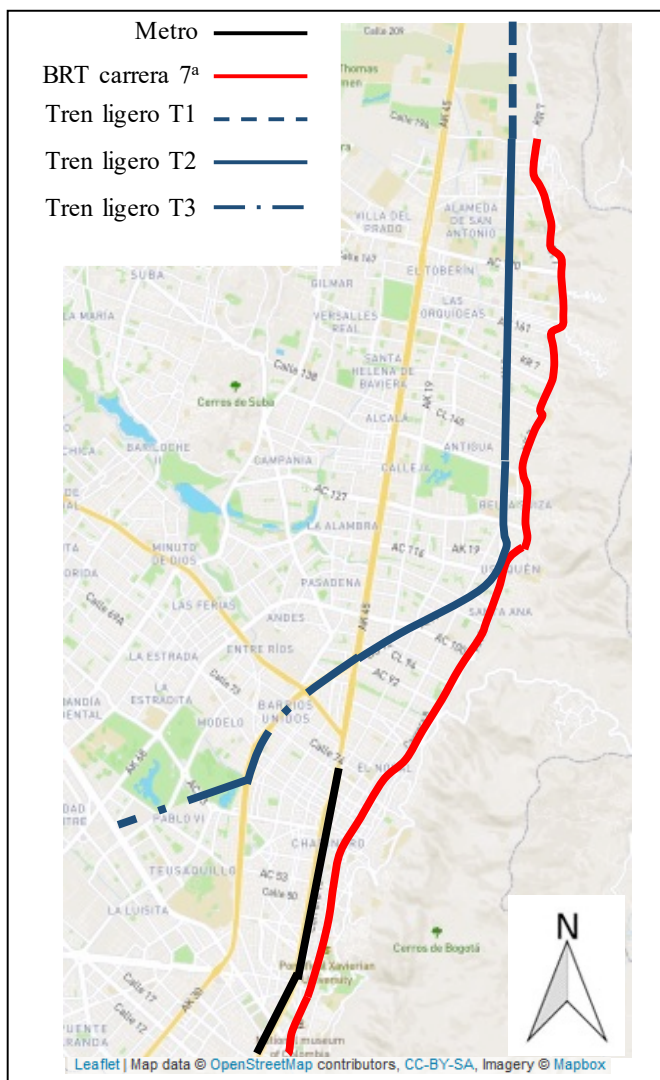
Figura 1 Propuesta de infraestructura de transporte público en el corredor nororiental de Bogotá

En la figura 1 se muestra la infraestructura propuesta para el corredor nororiental, la línea propuesta del metro llega hasta la calle 72, el BRT avanzaría de forma paralela al metro hasta la 72 y continuaría por el corredor nororiental, y la línea de tren ligero del norte hace uso de un corredor férreo de forma paralela a la línea propuesta de BRT hasta la 116 y continua hasta las poblaciones de Chía y Zipaquirá que corresponden a la Gobernación de Cundinamarca. La línea férrea fue construida a finales del siglo XIX y tiene la ventaja de tener un mínimo de cruces a nivel, actualmente tiene una baja utilización.