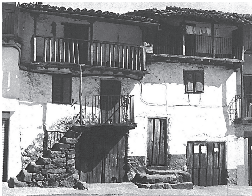
Figura 2. Villanueva del Conde, Salamanca. Fuente: Flores (1978: (3) 278).