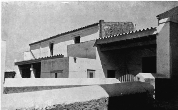
Ibiza. – Vivienda rural.