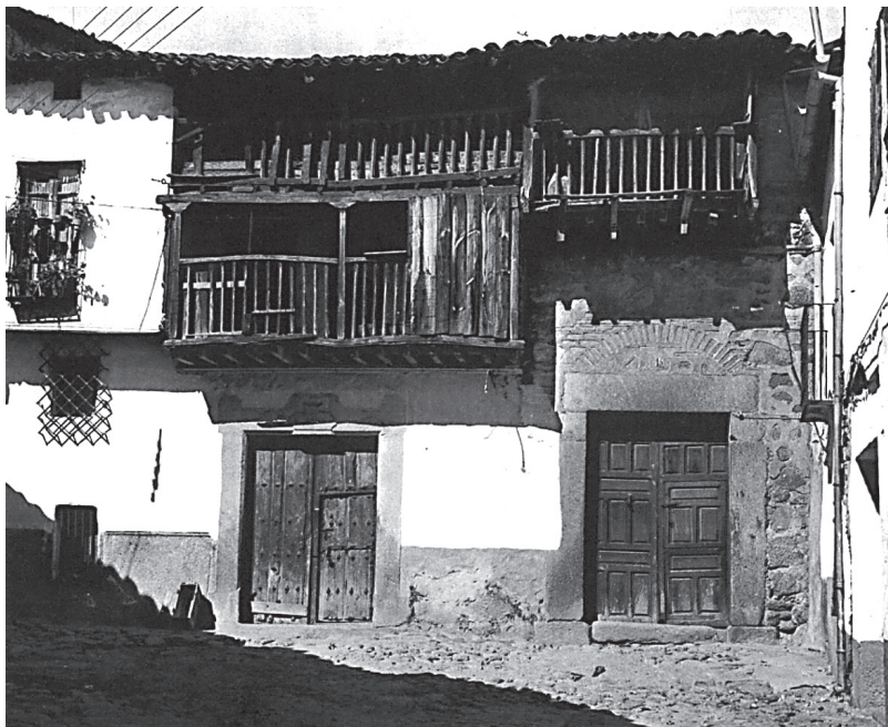
Figura 1. Arenas de San Pedro, Ávila.