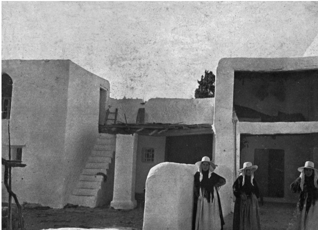
Figura 3. Imagen de portada de la Revista AC , número 21. Ibiza, Baleares.