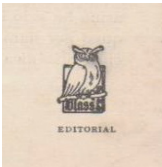
Figura 4. Logotipo de la Editorial Blass

Blass también se encargó de imprimir otras obras, de contenidos muy similares, en consonancia con otras editoriales alemanas asentadas en Madrid, como el caso de Rudolf Kadner Librero 29 , sita en la calle Serrano, número 17. Nos referimos a la obra El espacio vital , de Gerhart Jentsch, traducción directa del alemán de Lebensraum , calificada de valor literario “excelente” y cuya “publicación juzgamos conveniente” 30 .